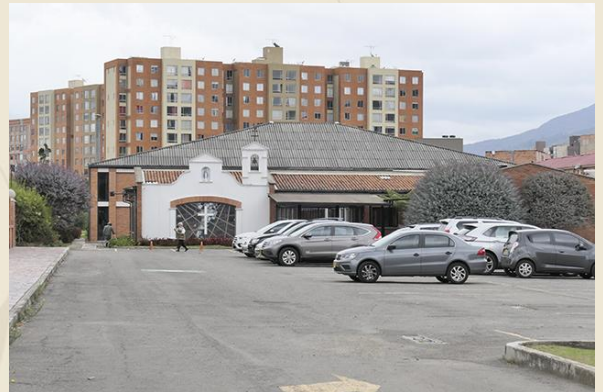
Casa de Encuentros Santa María.

Este lugar nos permitirá desarrollar una práctica más en concordancia con estados de contemplación y paz interior.